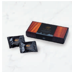
プレミアム・チョコレート ダーク (5枚/10枚)