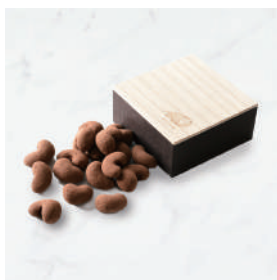
カシューチョコ (ギフト箱入)