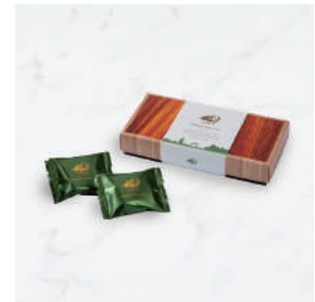
プレミアム・チョコレート 抹茶 (5枚)