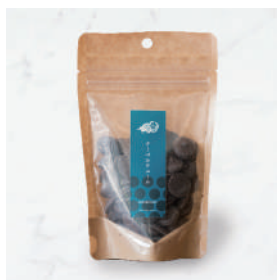
オリジナル・ クーベルチュール 78%