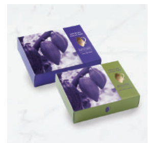
クランチカカオバー (ダークチョコ/抹茶)

詳しい商品情報については、オンラインショップをご覧ください！ URL: https://dari-k.shop-pro.jp/