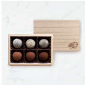
カカオが香る チョコレート・トリュフ (3粒/6粒/12粒)

普段、京都でしか手に入らない商品を、その場で購入♪ Dari Kのチョコレートは、インドネシアの契約農家と真心込めて育てたカカオを 使用しています。濃厚だけどさっぱりとしたビターチョコレートを軸に、自宅用はもちろん、 手土産や贈り物にも最適です。それぞれ専用の手提げ袋もご用意ございます。