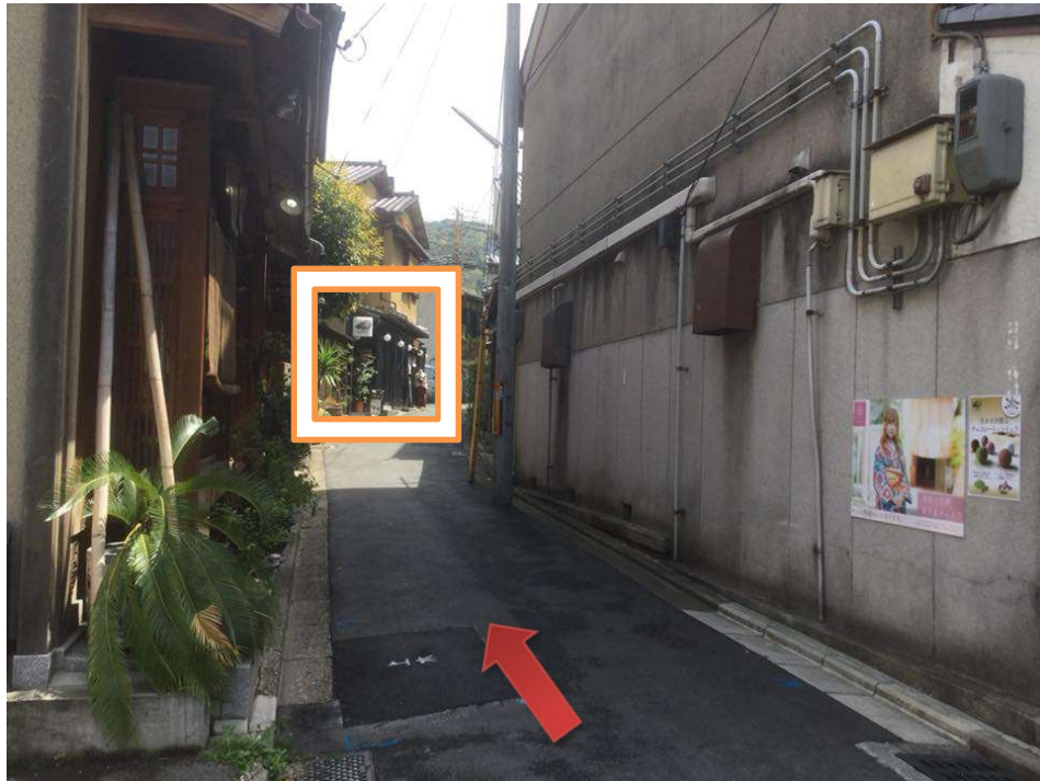
細道を曲がると、すぐに Dari K 看板が見えてきます。 It is right over there.